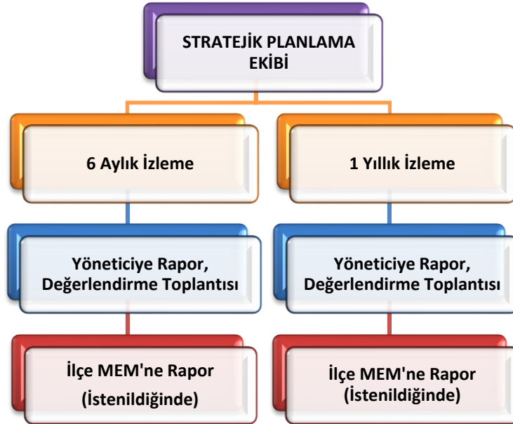
Şekil 8 Stratejik Plan İzleme ve Değerlendirme Modeli

Okulumuz Stratejik Planı izleme ve değerlendirme çalışmalarında 5 yıllık Stratejik Planın izlenmesi ve 1 yıllık gelişim planının izlenmesi olarak ikili bir ayrıma gidilecektir. Stratejik planın izlenmesinde 6 aylık dönemlerde izleme yapılacak denetim birimleri, il millî eğitim müdürlüğü ve Bakanlık denetim ve kontrollerine hazır halde tutulacaktır. Yıllık planın uygulanmasında yürütme ekipleri ve eylem sorumlularıyla aylık ilerleme toplantıları yapılacaktır. Toplantıda bir önceki ayda yapılanlar ve bir sonraki ayda yapılacaklar görüşülüp karara bağlanacaktır. 2024-2028 yıllara göre faaliyet raporları (Haziran-Temmuz) hazırlanarak İl / İlçe Milli Eğitim Müdürlüğü Strateji Geliştirme Hizmetleri Şube Müdürlüğüne gönderilmek üzere hazır tutulacaktır.